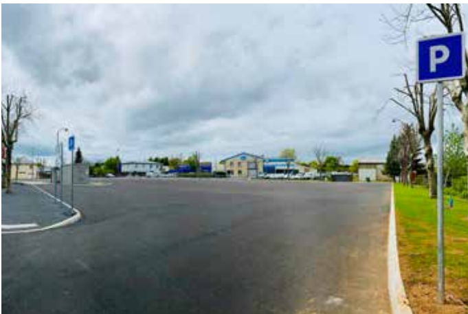
PARKING AVENUE AUGUSTIN CHAUVET

Permet d'éviter le dangereux carrefour de la gare et facilite l'accès à la déchetterie.