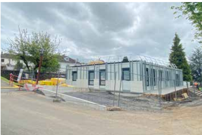
UNITÉ DE DIALYSE

Dans un nouveau local rénové, situé en centre ville, amélioration de l'accueil des personnes sans domicile fixe via le service d'accueil d'urgence le 115.