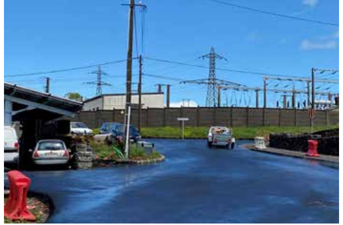
LIAISON AVENUE AUGUSTIN CHAUVET ET BOULEVARD PASTEUR

Attendue depuis des années, la réfection de la rue est enfin terminée avec une circulation en sens unique dans le sens de la descente.