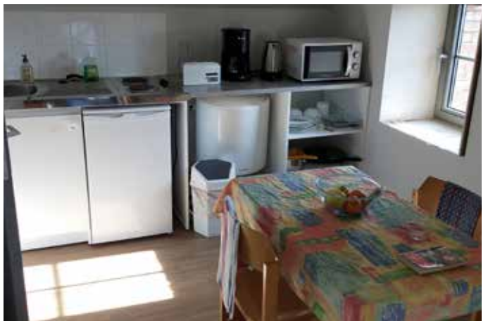
HALTE DE NUIT

Changement de l'image du quartier et création d'une aire de co-voiturage