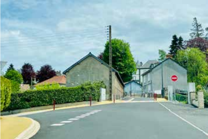
RUE DES PRADALS

Attendue depuis des années, la réfection de la rue est enfin terminée avec une circulation en sens unique dans le sens de la descente.